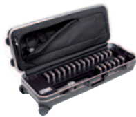
Synexis C20 Transport- und Ladetrolley für 20 Taschenempfänger und Taschensender sowie einem Handsender (Abbildung mit Zubehör)