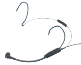
TG H54c Nackenbügelmikrofon