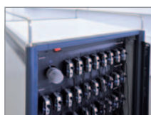
Fach für Hörer und Zubehör