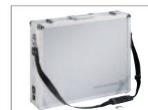
FÜR UNTERWEGS Abschließbar und mit praktischem Tragegurt.