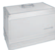
Synexis T12 Transportkoffer zur flexiblen Bestückung mit 12 Empfän- gern und 12 Kopfhörern oder 24 Empfängern, zudem Sender, Mikrofone und Zubehör