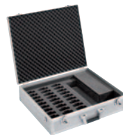
Synexis C30 Transport- und Ladekoffer für 30 Taschenempfänger und Taschensender