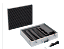
Klapp- und abnehmbarer Deckel