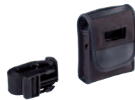
Synexis TRB Wetterfeste Gürteltasche für Taschensender oder Empfänger