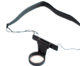
ZUV 85 Umhängevorrichtung für Handsender