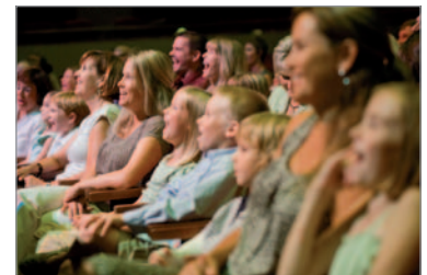
Induktionsschleife für Hörgeräte