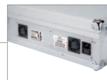
Integriertes Netzteil und aktiver Lüfter