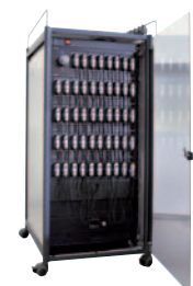
Synexis SG24 Standgehäuse mit Rollen und Tür, individuell bestückt mit Ladegeräten Synexis C8/C10 (Abbildung mit Zubehör)