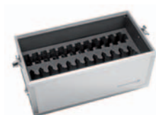
Synexis T12E Optionale Empfänger-/Hörer- Etage mit Clipverschluss für Synexis T12