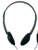
DT 2 Kopfhörer