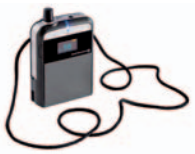
Synexis RP8 Taschenempfänger