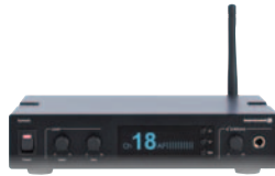
Synexis TS8 Stationärer Sender