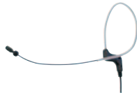
PEM 60.18 Ohrbügelmikrofon