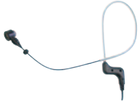
PEM 10.18 Ohrbügelmikrofon