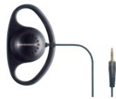
DT 1 Ein-Ohrhörer