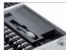
MIKROFONLADEFACH Optionaler Ladeeinheit für einen Handsender.

ZAHLEICHE LADEFÄCHER Laden Sie gleichzeitig bis zu 30 Taschenempfänger/-sender für den Akkubetrieb. Binnen kürzester Zeit sind sie durch intelligente Schnellladeelektronik wieder einsatzbereit.