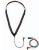
IL 200 Induktionsschleife für induktive Übertragung auf Hörgeräte